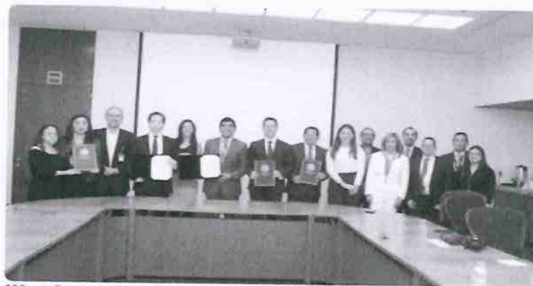
SRE y el Colegio Nacional del Notariado Mexicano firman Convenio de Concertación de Acciones