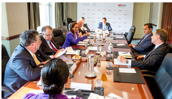
Reunión de trabajo en Toronto

Resaltó que una prioridad en el sector turístico es la innovación y la competitividad, y que para ello se trabaja en la diversificación de los