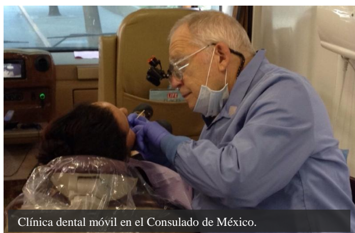
Clínica dental móvil en el Consulado de México.

El 8 de julio el Consulado de México en Seattle, en colaboración con Medical Teams International, instaló una clínica dental móvil en las parte exterior de las instalaciones del Consulado. La clínica móvil ofreció servicios dentales gratuitos para personas de bajos recursos con necesidad urgente de atención.