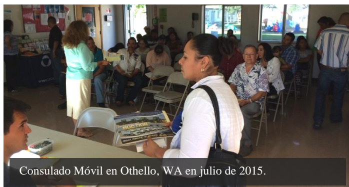
Consulado Móvil en Othello, WA en julio de 2015.

Durante el mes de julio, el Consulado continuó con el calendario de Consulados Móviles y Jornadas Sabatinas. En la sede consular, el sábado 11 de julio se atendió a más de 120 personas para el trámite de matrículas consulares y pasaportes.