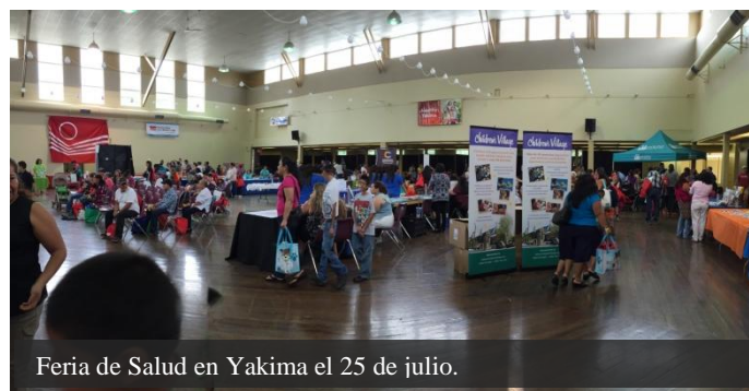
Feria de Salud en Yakima el 25 de julio.

El pasado 25 de julio personal del Departamento de Comunidades del Consulado estuvo presente con una mesa de información en un evento familiar para la promoción de la salud en la ciudad de Yakima.