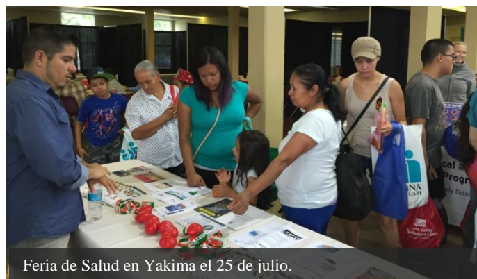
Feria de Salud en Yakima el 25 de julio.

El pasado 25 de julio personal del Departamento de Comunidades del Consulado estuvo presente con una mesa de información en un evento familiar para la promoción de la salud en la ciudad de Yakima.