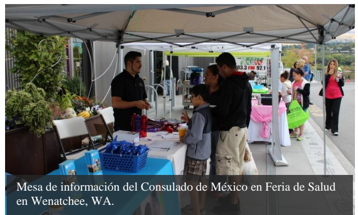
Mesa de información del Consulado de México en Feria de Salud en Wenatchee, WA.

Durante la Semana Binacional de Salud, se organizaron ferias de salud en distintas partes del estado.