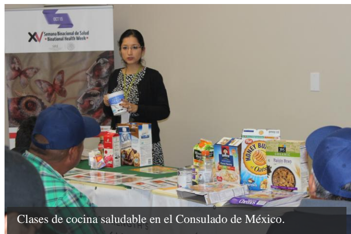
Clases de cocina saludable en el Consulado de México.

El Consulado de México en Seattle agradece la participación de Sea Mar, Susan G. Komen Puget Sound Affiliate, Seattle & King County Public Health, Amerigroup, Virginia Mason, United Healthcare, Regence Health Plans, Molina Healthcare, Community Health Plan of Washington, Seattle Children's Hospital, UW Medicine y Coordinated Care.