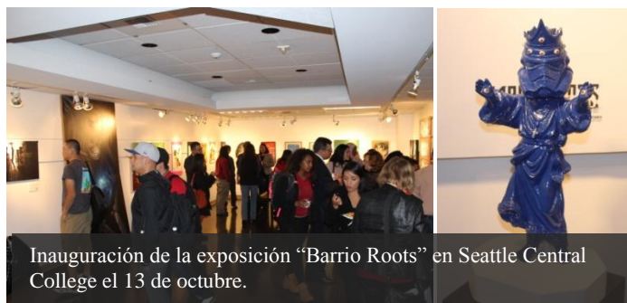
Inauguración de la exposición “Barrio Roots” en Seattle Central College el 13 de octubre.

El 13 de octubre, el Consulado de México en Seattle, en conjunto con Seattle Central College, inauguró la exposición de arte titulada “Barrio Roots: Gráfica Transfronteriza”, en la Galería de Arte M. Rosetta Hunter de dicha universidad.