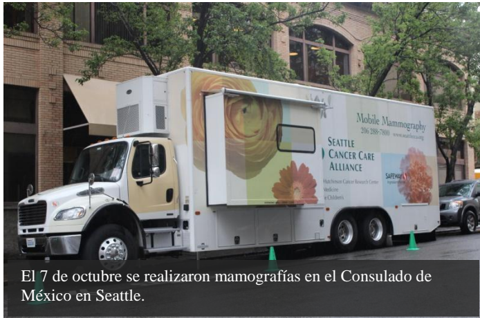
El 7 de octubre se realizaron mamografías en el Consulado de México en Seattle.

En el área de Ventanilla de Salud del Consulado se llevaron a cabo una serie de actividades de salud durante la última semana de septiembre y todo el mes de octubre. El 8, 15 y 22 de octubre, cocineras expertas de Cooking Matters llevaron a cabo clases gratuitas sobre cocina saludable.