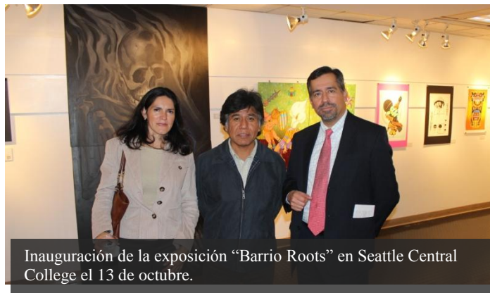
Inauguración de la exposición “Barrio Roots” en Seattle Central College el 13 de octubre.