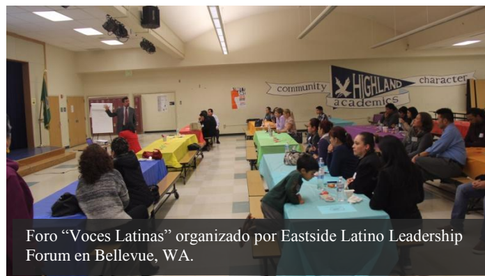
Foro “Voces Latinas” organizado por Eastside Latino Leadership Forum en Bellevue, WA.

Eastside Latino Leadership Forum es una organización creada con el fin de empoderar a la comunidad latina vecindada en la zona este del área metropolitana de Seattle. Su cometido es abogar por temas de educación, salud y justicia social, así como el desarrollo de líderes dentro de la comunidad, y promover el conocimiento y el aprecio a la cultura latina.