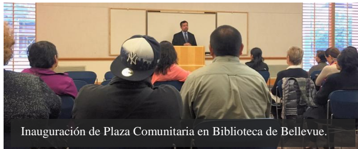
Inauguración de Plaza Comunitaria en Biblioteca de Bellevue.

Con la finalidad de brindar alternativas de educación formal y no formal a los mexicanos que viven en el exterior, las Plazas Comunitarias ofrecen una amplia gama de servicios. Se trata de un espacio educativo que cuenta con una sala de televisión educativa vía satélite, el área de educación en línea vía Internet y un salón tradicional, donde se reúnen jóvenes y adultos para aprender apoyados en el uso de diversas tecnologías.