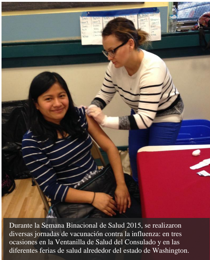
Durante la Semana Binacional de Salud 2015, se realizaron diversas jornadas de vacunación contra la influenza: en tres ocasiones en la Ventanilla de Salud del Consulado y en las diferentes ferias de salud alrededor del estado de Washington.

En miércoles 7 de octubre se realizaron 91 mamografías y Papanicolaou gracias a la colaboración de Susan G. Komen Puget Sound Affiliate y Seattle Cancer Care Alliance.