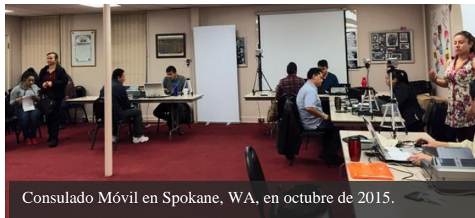
Consulado Móvil en Spokane, WA, en octubre de 2015.

Durante el mes de octubre se continuó con el calendario de Consulados Móviles y Jornadas Sabatinas. Así, el sábado 24 de octubre se atendió en la sede consular a más de 100 personas para el trámite de matrículas consulares y pasaportes.