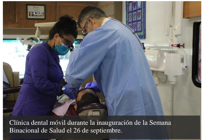
Clínica dental móvil durante la inauguración de la Semana Binacional de Salud el 26 de septiembre.

Los días 6 y 20 de octubre, se aplicaron 609 vacunas contra la Influenza, de manera gratuita en colaboración con Wallgreens. El 26 de octubre se realizó una última jornada de vacunación en conjunto con Virginia Mason.