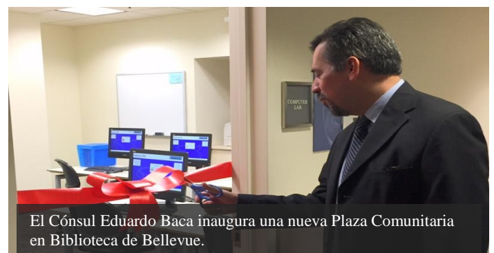
El Cónsul Eduardo Baca inaugura una nueva Plaza Comunitaria en Biblioteca de Bellevue.

El 19 de octubre, el Cónsul Eduardo Baca Cuenca participó en la inauguración de una nueva Plaza Comunitaria en el estado de Washington. Inaugurada en conjunto con el Sistema de Bibliotecas de King County, esta nueva Plaza Comunitaria se encuentra ubicada en la Biblioteca Bellevue, en el número 1111 de la 110th Avenue NE, Bellevue, WA 98004