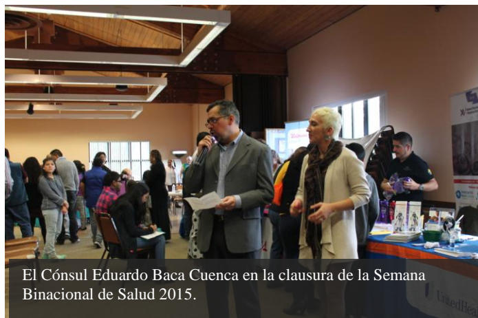
El Cónsul Eduardo Baca Cuenca en la clausura de la Semana Binacional de Salud 2015.

El 25 de octubre concluyó de manera oficial la XV Semana Binacional de Salud, que se llevó a cabo del 26 de septiembre al 25 de octubre en diversas ciudades del estado de Washington. El Ministro Eduardo Baca Cuenca, Cónsul de México en Seattle, clausuró oficialmente este mes de actividades con la participación del Consulado en una Feria de Salud y Seguridad en la ciudad de Bothell, Washington.