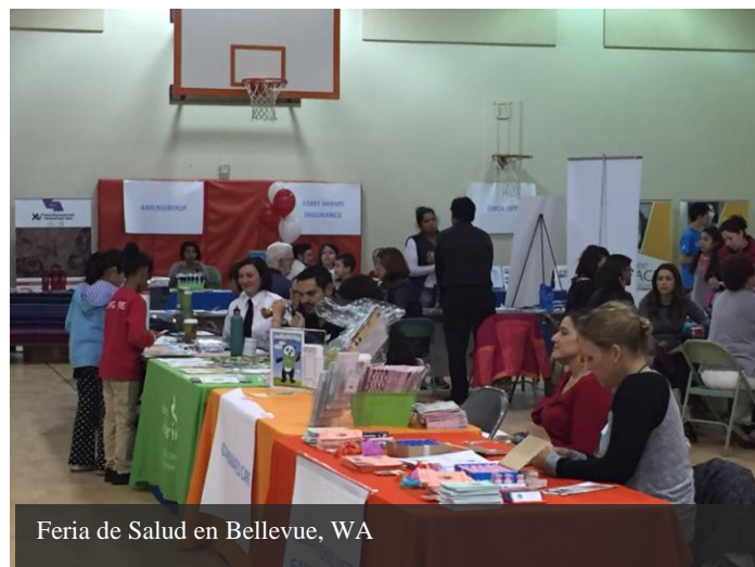
Feria de Salud en Bellevue, WA

personas se beneficiaron de pruebas de colesterol, glucosa y presión arterial; mamografías; Papanicolaou; exámenes de la vista y vacunas contra la influenza, entre otras. Todos estos servicios fueron proporcionados de manera totalmente gratuita.