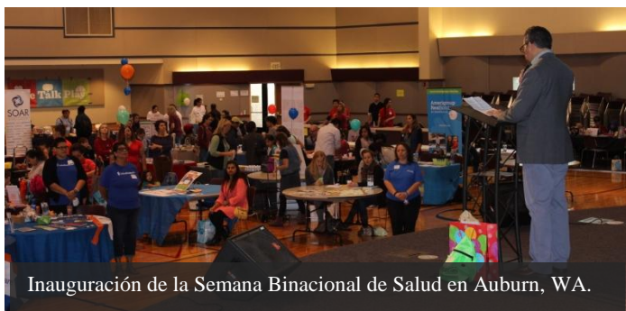
Inauguración de la Semana Binacional de Salud en Auburn, WA.

El sábado 26 de septiembre, el Cónsul Eduardo Baca Cuenca inauguró oficialmente la XV Semana Binacional de Salud México-EUA, con la participación del Consulado y diversas agencias en una Feria de Salud y Seguridad en la ciudad de Auburn, Washington.