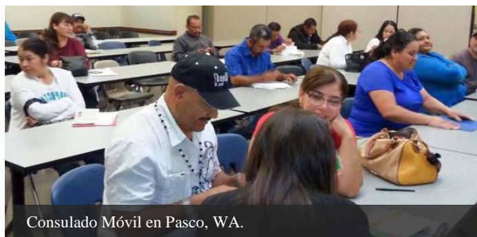
Consulado Móvil en Pasco, WA.

Walla Walla, WA – 3 y 4 de octubre Spokane, WA – 17 y 18 de octubre Omak, WA – 31 de octubre y 1 de noviembre Brewster, WA – 7 y 8 de noviembre Yakima, WA – 5 y 6 de diciembre