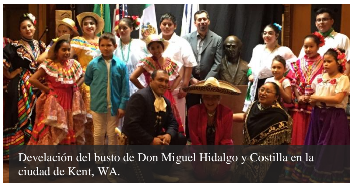
Develación del busto de Don Miguel Hidalgo y Costilla en la ciudad de Kent, WA.

El 16 de septiembre, el conjunto se presentó en The Seasons Performing Hall, mientras que el 17 tuvieron dos presentaciones en la escuela Garfield de esa localidad.