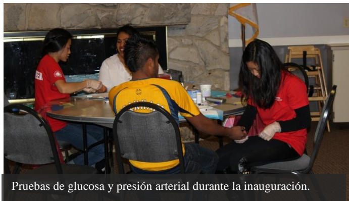
Pruebas de glucosa y presión arterial durante la inauguración.

de la población de origen mexicano y latinoamericano en Estados Unidos y Canadá.