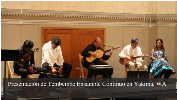
Presentación de Tembembe Ensamble Continuo en Yakima, WA

La agenda de actividades continuó con una serie de presentaciones del grupo Tembembe Ensamble Continuo en la ciudad de Yakima, Washington; acercando así esta expresión cultural a la comunidad mexicana que reside en el Valle de Yakima, en la parte este-central del estado.