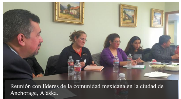
Reunión con líderes de la comunidad mexicana en la ciudad de Anchorage, Alaska.