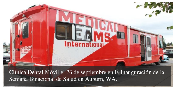
Clínica Dental Móvil el 26 de septiembre en la Inauguración de la Semana Binacional de Salud en Auburn, WA.

La Semana Binacional se llevará a cabo del 26 de septiembre al 25 de octubre con el tema "Quince Años Trabajando por tu Salud". En esta edición, el Consulado de México en Seattle contará con la participación de docenas de instituciones de salud y servicios comunitarios brindando pruebas de colesterol, glucosa y presión arterial; mamografías; Papanicolaou; exámenes de la vista; vacunas contra la influenza, y servicios dentales, entre otros. Todos estos servicios proporcionados de manera totalmente gratuita.