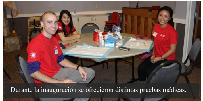
Durante la inauguración se ofrecieron distintas pruebas médicas.

El sábado 26 de septiembre, el Cónsul Eduardo Baca Cuenca inauguró oficialmente la XV Semana Binacional de Salud México-EUA, con la participación del Consulado y diversas agencias en una Feria de Salud y Seguridad en la ciudad de Auburn, Washington.