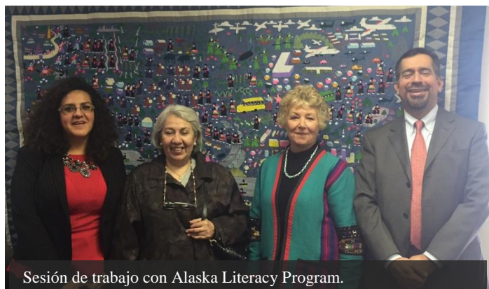
Sesión de trabajo con Alaska Literacy Program.

El Ministro Baca Cuenca reafirmó que el Consulado en Seattle realizará visitas periódicas a distintas ciudades en Alaska, con la finalidad de atender las necesidades de documentación y protección que tenga la comunidad mexicana en este estado. Con dicho fin, destacó que se creará un “Consulado sobre Ruedas” específico cuyo fin primordial será atender adecuadamente a la comunidad mexicana en Alaska. El Consulado sobre Ruedas es un modelo exitoso en todo Estados Unidos para atender poblaciones alejadas a las sedes consulares.