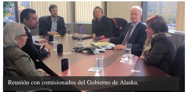
Reunión con comisionados del Gobierno de Alaska.

A partir del 1° de diciembre de 2015, el Gobierno de México, a través de la Secretaría de Relaciones Exteriores, atenderá a la comunidad mexicana radicada en el estado de Alaska a través del Consulado de México en Seattle.