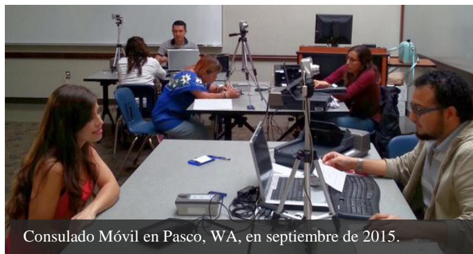
Consulado Móvil en Pasco, WA, en septiembre de 2015.

Durante el mes de septiembre, se continuó con el calendario de Consulados Móviles.