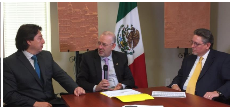
Entrevista con Alabama TV sobre la relación económica México-Alabama