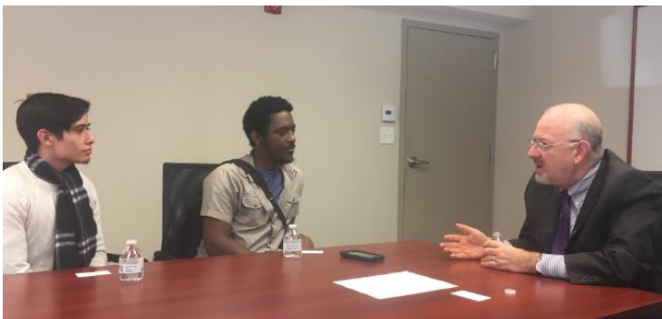
Entrevista a estudiantes de SCAD que trabajan en un proyecto sobre migración.