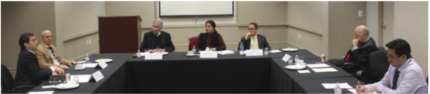
Reunión con Cónsules de Latinoamérica