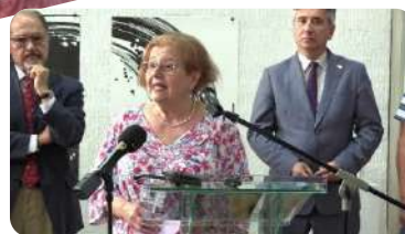
Grafiche vizije 7