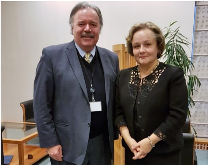
Reunión con Europarlamentaria Laima Andrikiene