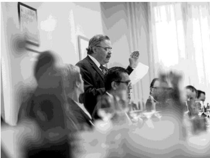
Conversación con VOKA en Amberes

En noviembre intensificamos las relaciones con Bélgica, particularmente en el sector económico, destaco la reunión que sostuve con la Cámara Regional de Flandes (VOKA, por sus siglas en neerlandés). En un diálogo franco con empresarios belgas pude constatar el interés que existe en los empresarios belgas por trabajar con México. Los empresarios que ya cuentan con inversiones en nuestro país reiteraron la calidad de la mano de obra mexicana así como la creciente facilidad para emprender negocios.