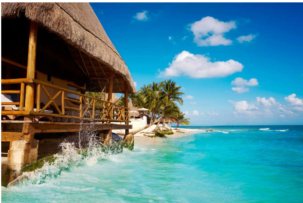
Playa del Carmen, México