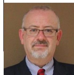
Javier Díaz de León Cónsul General de México en Atlanta