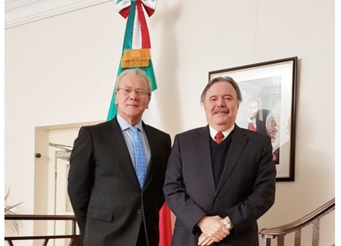
Emb. de Perú, Gonzalo Gutiérrez y Emb. Eloy Cantú Segovia

2017 es un año de retos para México que demanda el compromiso de todos los mexicanos para salir adelante. Con ello en mente, en esta Embajada trabajamos día a día con el objetivo de mostrar desde esta ciudad de Bruselas la relevancia e importancia de nuestro país en el mundo.